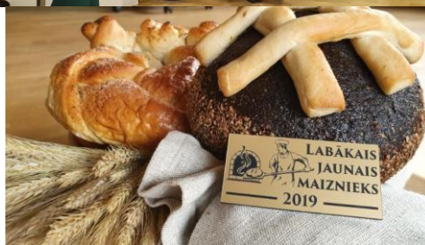
Foto no 2019.gada konkursa.