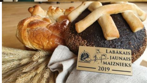
Foto no 2019.gada konkursa.