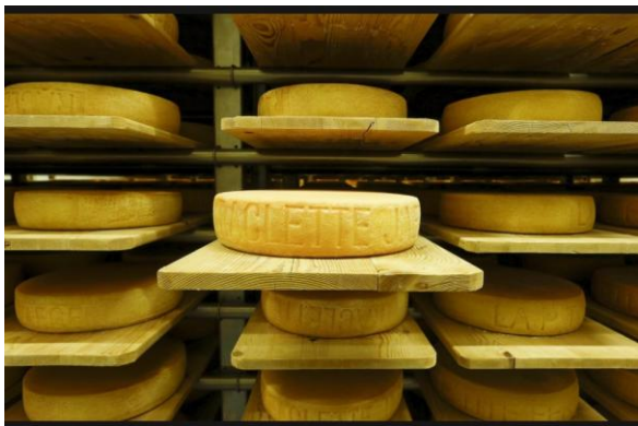
FOTO: Kurās Eiropas valstīs ir augstākās pārtikas cenas un kurās - zemākās?

Jaunākais pasaules pārtikas cenu indekss patērētājiem uzrāda negatīvas tendences, norāda Pasaules Ekonomikas foruma eksperti.